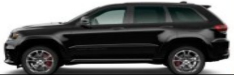
Vehículo Sospechoso Similar

Si usted tiene información sobre este caso, usted puede llamar Testigo Silencioso al: