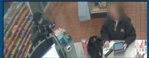
Sospechoso y Víctima