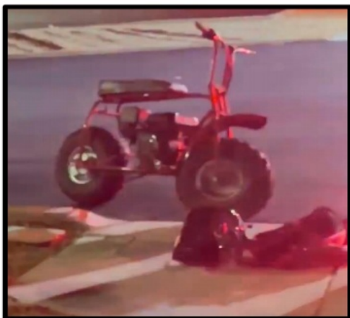
Moto del Víctima