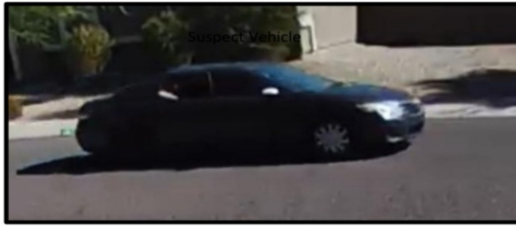
Vehículo de Sospechoso