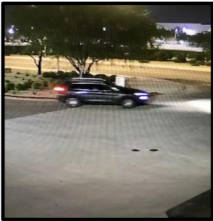
Vehículo de Sospechoso